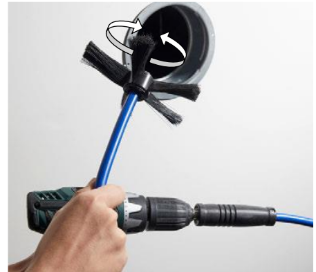
传动顺畅, 双向旋转

特制排刷头 (5 排贝纶丝直刷毛构造, 刷毛倾斜角度精妙), 由德国 Wöhler 公司与德国迪尔门通风卫生能力评估中心共同研发, 外观和设计版权独有, 仿制盗版必究。